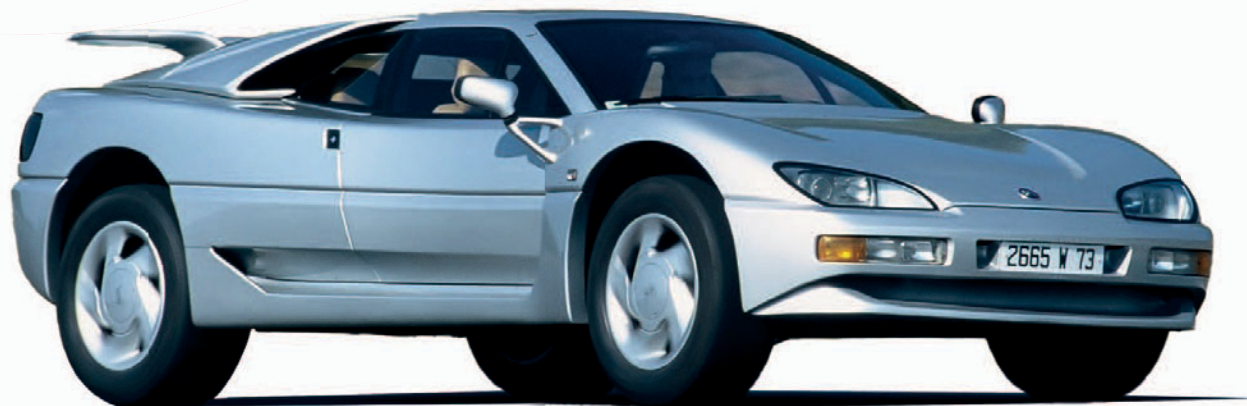
1992 - MEGA TRACK : un monstruo de alta tecnología, mezcla de 4x4 deportivo y Supercoche increíble.

El resultado es una auténtica marca de automoción con dos actividades principales: vehículos de ocio, por un lado, y vehículos de alto rendimiento y prestigio, por otro.