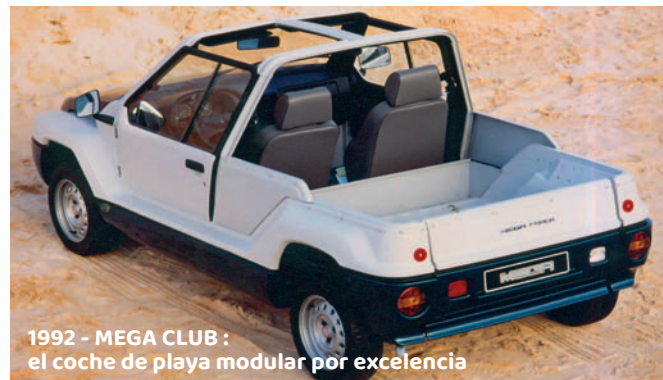
1992 - MEGA CLUB : el coche de playa modular por excelencia