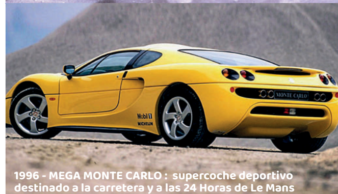
1996 - MEGA MONTE CARLO : supercoche deportivo destinado a la carretera y a las 24 Horas de Le Mans