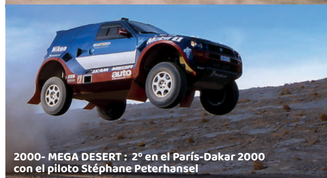
2000 - MEGA DESERT : 2º en el París-Dakar 2000 con el piloto Stéphane Peterhansel