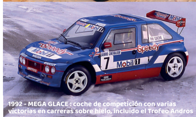
1992 - MEGA GLACE : coche de competición con varias victorias en carreras sobre hielo, incluido el Trofeo Andros